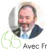
François Braun , ministre de la Santé et de la Prévention

65 Visibilité sur 3 ans de la carte scolaire, instance de dialogue et de coordination Préfet/DASEN, territoires éducatifs ruraux... Je suis mobilisé avec Elisabeth Borne pour garantir à tous un service public de l'Éducation de qualité, partout sur le territoire.