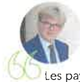
Marc Fesneau , ministre de l'Agriculture et de la Souveraineté alimentaire

65 Avec France Ruralités, le Gouvernement est mobilisé pour répondre aux besoins de nos concitoyens. D'ici à la fin de l'année, pour les soins du quotidien : une équipe soignante proposée à chaque Français fragile et le renforcement de la coopération entre professionnels de santé (médecins, infirmiers, pharmaciens). Pour les soins urgents : une réponse médicale garantie avec la généralisation du service d'accès aux soins (SAS) et le déploiement d'équipes mobiles d'urgence adaptées aux territoires (télé-médecine, paramédicaux, HéliSmur). D'ici 2027, plus de médecins généralistes avec une 4e année attractive dans les zones sous-denses, 4000 maisons de santé pluriprofessionnelles et plus de 100 Médicobus partout en France.