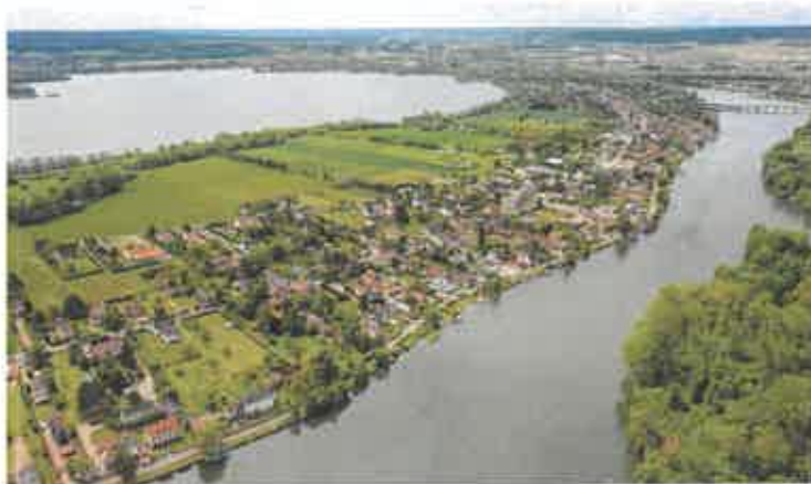
Prise de vue aérienne d'État chargée de la Ruralité, entame une démarche de bilan et d'évaluation de l'Agenda rural, avec des inspections interministérielles, des professionnels du secteur ainsi que plus de 70 déplacements sur le terrain à la rencontre des acteurs des territoires ruraux. Les résultats de cette évaluation ainsi que le travail partenarial ont donné naissance à France Ruralités.

D'abord avec la création du programme Action Cœur de Ville (ACV) dont la première phase, lancée en 2018, a permis de renforcer l'attractivité et de soutenir 234 villes « moyennes » (plus de 20 000 habitants) dans leur développement et dans leur capacité à affronter les transitions écologiques, démographiques et économiques : sur la période 2018-2026, ce sont 10 milliards d'euros qui auront été mobilisés par l'État dans le cadre du programme.