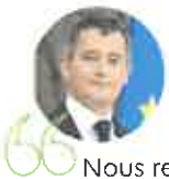
Gérald Darmanin , ministre de l'Intérieur et des Outre-mer

65 Nous renforçons notre action et nos moyens en matière de sécurité, en lien constant avec les élus, partout sur le territoire. À la demande du Président de la République, 200 nouvelles brigades de gendarmerie seront créées en particulier dans les zones rurales, après concertation avec les élus locaux. Par ailleurs, 3000 "gendarmes verts" seront formés dans les territoires pour lutter contre les atteintes à l'environnement et aux espèces vivantes.