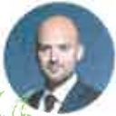
Jean-Noël Barrot , ministre déléguée chargée de la Transition numérique et des Télécommunications

Le numérique constitue un puissant levier au service des territoires et de la réduction des fractures territoriales. L'accès à la 4G et à la fibre ne doit pas représenter un frein pour nos concitoyens. Avec le New Deal mobile et le plan France Très Haut Débit, c'est-à-dire l'accélération du déploiement de la 4G et de la fibre, le Gouvernement s'engage à investir pour que tous les Français puissent bénéficier de la connectivité numérique au domicile ou au travail.