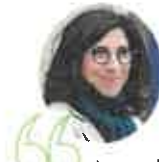
Rima Abdul-Malak , ministre de la Culture

65 La prise en compte des besoins spécifiques des usagers les plus éloignés des services publics est une priorité de ma feuille de route : j'ai d'ailleurs fait du renforcement du maillage de France services pour renforcer encore la couverture territoriale et du développement de l'aller-vers deux axes stratégiques du programme France Services pour 2023-2024. Notamment avec des bus itinérants aux facteurs guichetiers mobiles en passant par les France Services multi-sites, nous développons un panel de réponses innovantes, co-construites et adaptées aux défis des territoires ruraux.