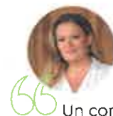
Olivia Grégoire , ministre déléguée chargée des Petites et moyennes entreprises, du Commerce, de l'Artisanat et du Tourisme

65 La politique culturelle en faveur de la ruralité, politique prioritaire du ministère de la Culture, est autant transversale que partenariale. Elle s'appuie sur les ressources culturelles des territoires, la mobilisation des opérateurs, des structures culturelles labellisées et la participation des habitants. Elle se déploie dans des contractualisations avec les collectivités territoriales, en particulier dans la politique de généralisation de l'éducation artistique et culturelle, autour de projets patrimoniaux et architecturaux, de création artistique, de lecture publique. Elle soutient également l'innovation, avec le Fonds d'innovation territoriale pour des expérimentations au niveau local et national.