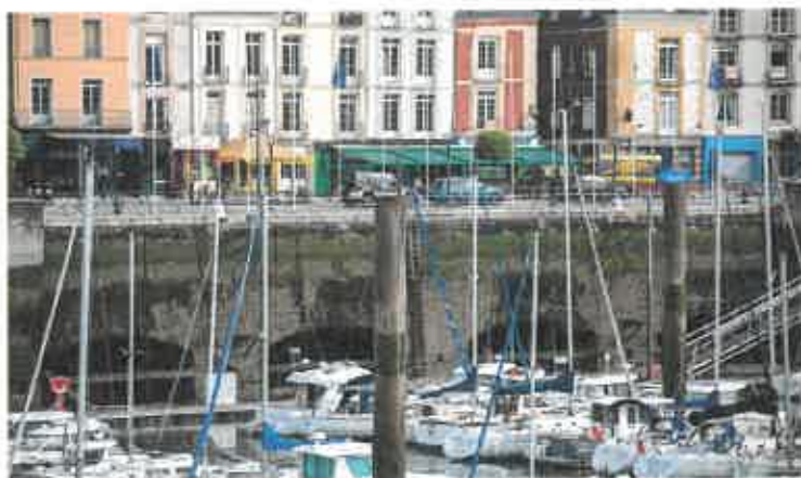
Port de plaisance de Dieppe - Programme Action Cœur de Ville

Dès son arrivée au Gouvernement, Dominique Faure, alors secrétaire d'État chargée de la Ruralité, entame une démarche de bilan et d'évaluation de l'Agenda rural, avec des inspections interministérielles, des professionnels du secteur ainsi que plus de 70 déplacements sur le terrain à la rencontre des acteurs des territoires ruraux. Les résultats de cette évaluation ainsi que le travail partenarial ont donné naissance à France Ruralités.