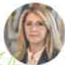
Patricia Mirallès , secrétaire d'Etat chargée des Anciens combattants et de la Mémoire

Le déploiement de 100 medicobus d'ici fin 2024, la généralisation des CPTS sur tout le territoire, la création d'une 4e année professionnalisante en médecine générale prioritairement dans les zones sous denses ou encore le déploiement de 4000 maisons de santé pluriprofessionnelles d'ici 2027 sont autant de leviers ambitieux portés par France Ruralités, au service d'un meilleur accès à la santé dans les territoires ruraux.