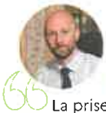
Stanislas Guerini , ministre de la Transformation et de la Fonction Publiques

65 Les paysages, les forêts, les productions agricoles et alimentaires sont intimement liés aux territoires ruraux. Dans un contexte où les consommateurs sont à la recherche de proximité concernant leur alimentation, il est essentiel de développer un ancrage territorial de l'alimentation sous une triple dimension : économique, environnementale et sociale. C'est tout le sens du développement des projets alimentaires territoriaux (PAT) qui s'appuient sur la production et l'approvisionnement alimentaire de proximité et sont créateurs de valeur ajoutée sur les territoires.