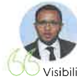
Pap Ndiaye , ministre de l'Éducation nationale et de la jeunesse

65 Nous renforçons notre action et nos moyens en matière de sécurité, en lien constant avec les élus, partout sur le territoire. À la demande du Président de la République, 200 nouvelles brigades de gendarmerie seront créées en particulier dans les zones rurales, après concertation avec les élus locaux. Par ailleurs, 3000 "gendarmes verts" seront formés dans les territoires pour lutter contre les atteintes à l'environnement et aux espèces vivantes.